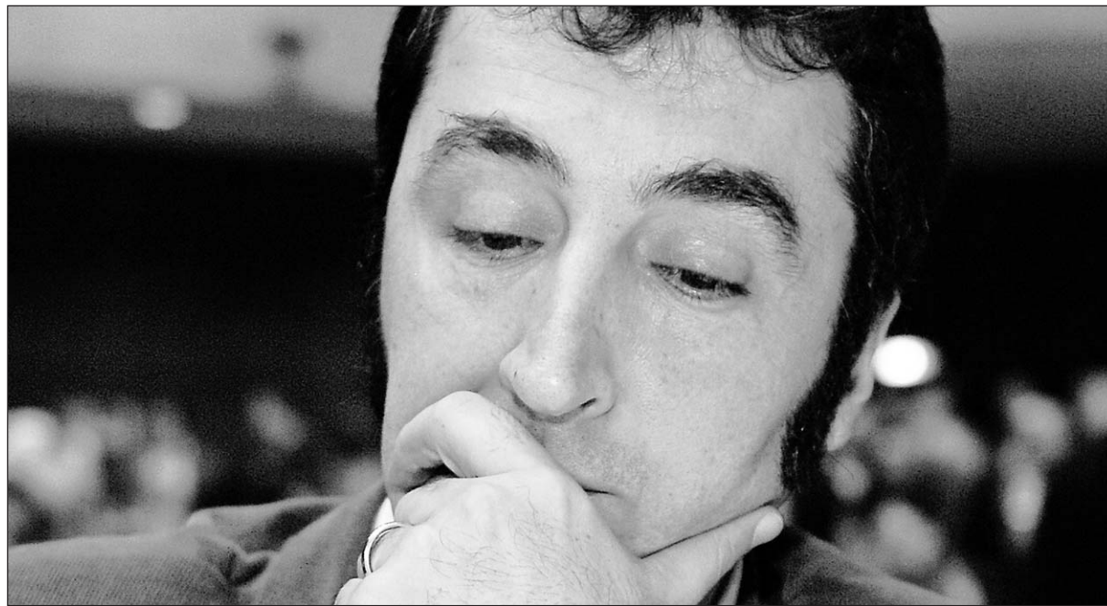
Der designierte Grünen-Chef Cem Özdemir am Samstag auf dem Landesparteitag der baden-württembergischen Grünen. Der 42-Jährige erhielt einen schweren politischen Dämpfer.

Für Cem Özdemir sollte der Parteitag der Südwest-Grünen die erste Bewährungsprobe auf dem Weg in die Bundespolitik sein. Doch er musste eine Niederlage einstecken.