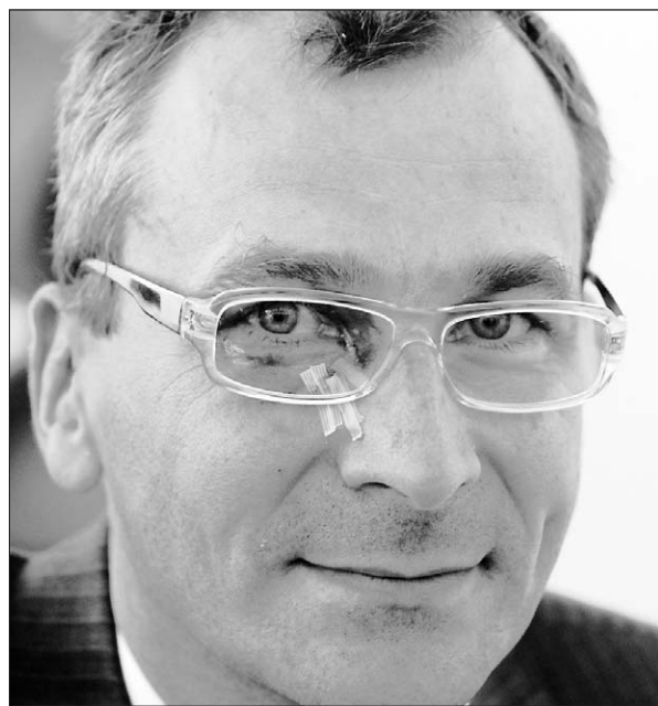
Der Grünen-Bundestagsabgeordnete Volker Beck (links) hat den Kölner Kardinal Joachim Meisner (rechts) als „Hassprediger“ bezeichnet.

Die Zahl der in jüngster Zeit bei Kämpfen zwischen türkischen Soldaten und der PKK getöteten Menschen stieg am Wochenende auf 79.