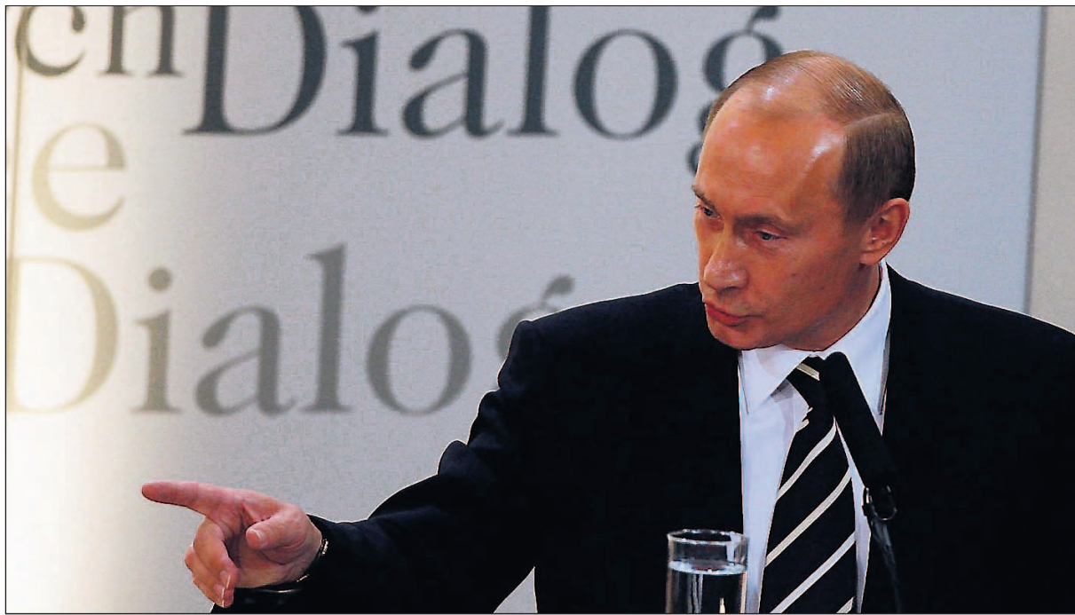
Der russische Präsident Wladimir Putin während seiner Rede in München.

Russlands Präsident Wladimir Putin machte auf der Münchner Sicherheitskonferenz in scharfer Form die USA für die Verschärfung der Krisen in der Welt verantwortlich.